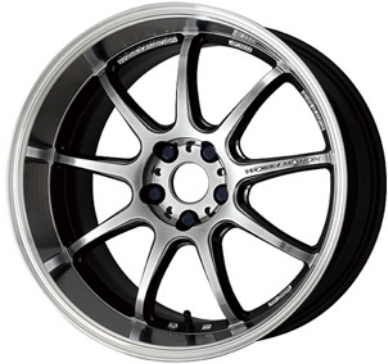
グリミットシルバーダイヤカットリム・GTSRC