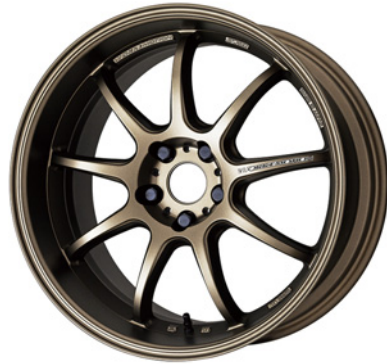
アッシュドチタン・AHG